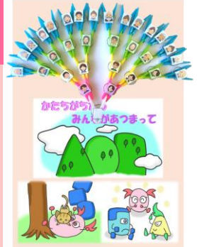
親子遊び ワークブック 制作：東海大学